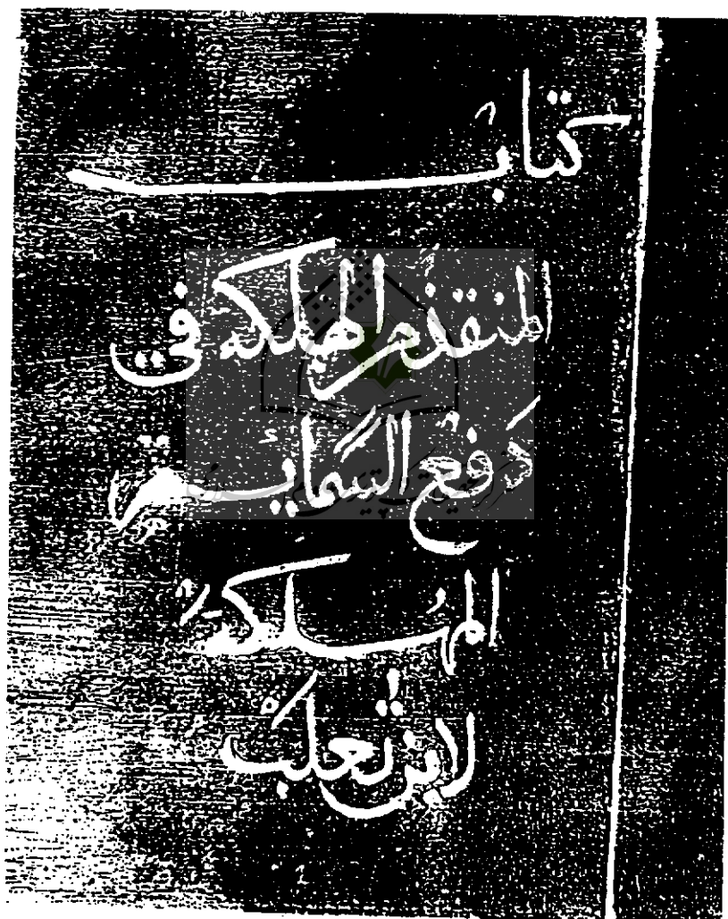
شکل (۳). تصویر صفحه‌عنوان کتاب المنقذ من الهلكة في دفع السمائم المهلكة، تألیف حسین بن ابی‌ثعلب بن مبارک از میکرو فیلم نسخه کتابخانه دانشگاه پرینستون به شماره (۱۰۹۸).

می‌گردند و همان شناخت، ایشان را از رخداد‌های مشهور و بیماری‌های کهنه می‌رهاند و بر کسانی که بخواهند ایشان را بفریزند، یا آهنگ رفتار بدی درباره‌شان در سر پیورانند، چیره‌شان می‌سازد و در این هنگام، جان‌هایشان به سلامت می‌مانند و تنها‌یشان از بیماری‌ها به صحت در می‌آیند و عمر‌هایشان دراز می‌گردد و دشمنان و ستیزگران برایشان گستاخ نمی‌گردند». (شکل ۳)